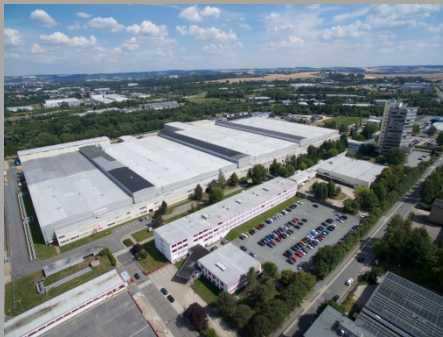
Firmengebäude der Starrag GmbH in Chemnitz