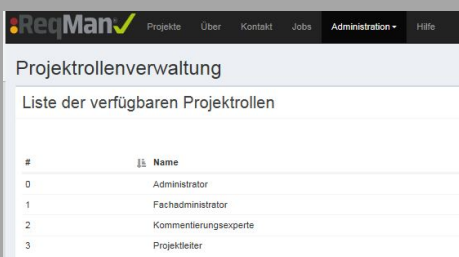
Projektrollenverwaltung in ReqMan®

Vor der Einführung von ReqMan® bearbeitete die Starrag GmbH Anforderungen mittels PDF oder Excel Dokumenten. Für die Abstimmung mit den Fachabteilungen wurden die Dokumente mehrfach geprüft. Allein die Aufbereitung dieser Dokumente mittels Copy and Paste beanspruchte in der Regel 1-2 Werktage. Durch die Kommentarfunktionen in Adobe Reader oder Microsoft Word kam es zu unterschiedlichen Wissenständen im Lastenheft. Veränderungen wurden nicht auf einen Blick erkannt und diskussionswürdige Kommentare teilweise übersehen.