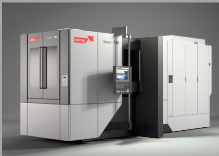
Das fünfachsiges Dreh-Fräszentrum Heckert T45